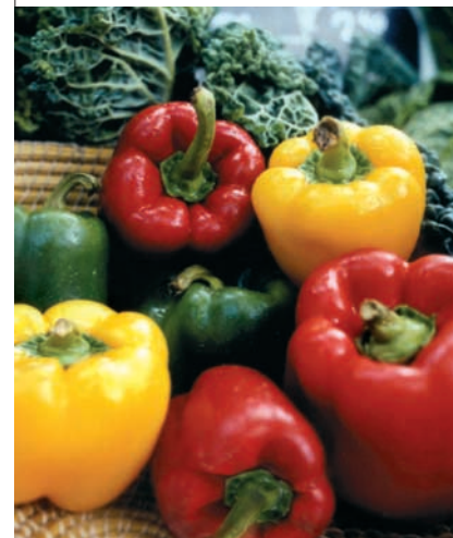
Paprika: Qualität oft mangelhaft, weil stark mit Pestiziden belastet

Gentechnik und Pestizidrückstände haben nichts in unseren Lebensmitteln zu suchen. Dabei ist sowohl der Handel, als auch die Politik gefragt. Gesetze müssen zum Schutz des Verbrauchers und der Umwelt erlassen werden, Kontrollen transparent gestaltet sein. Die Verbraucher spielen hierbei eine wichtige Rolle. Sie können Druck auf den Handel ausüben und ihn zwingen, Produktqualität zu garantieren.