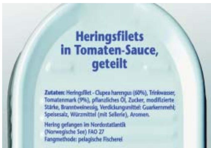
Beispiel für die vollständige Kennzeichnung eines Fischproduktes

Greenpeace prüft seit dem Jahr 2007 die Einkaufspraxis für Fisch und andere Meeresfrüchte von elf Handelsketten 1 . Da sich zu Beginn der Untersuchung nur ein einziges Unternehmen mit den Folgen seiner Einkaufspraxis beschäftigte, konzentrierte sich die Greenpeace Arbeit in den ersten drei Jahren darauf, bei allen Handelsketten die Grundlage für eine nachhaltige Fischeinkaufspraxis zu schaffen. Mittlerweile haben alle elf Unternehmen Einkaufsrichtlinien erstellt und erläutern zudem für den Verbraucher transparent im Internet, mit Informationsblättern an der Fischtheke, Beschilderungen oder in Werbeproschüren, wie sie auf die Überfischung der Meere reagieren. Auch erste Maßnahmen zur nachhaltigen Sortimentsgestaltung werden bereits umgesetzt: So wurden Aal, Rotbarsch, Blauflossen-Thunfisch oder Dornhai bei einigen Unternehmen aus dem Sortiment genommen. Des Weiteren verbessert sich die Kennzeichnung der Produkte. Sie zeigt neben dem Handelsnamen, mittlerweile auch immer häufiger den lateinischen Namen der Fischart, die genauen Fanggebiete und