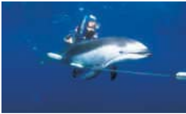
Seit 1983: Aktionen gegen Treibnetzfischerei

1982 Greenpeace unterstützt Elbfischer gegen DOW Chemical. Der Konzern pumpt u.a. Quecksilber in die Elbe und vergiftet die Fische. ▶ Die IWC beschließt Verbot der kommerziellen Waljagd, gültig ab 1986. ▶ Krach im deutschen Büro über den Führungsstil: Einige Ehrenamtliche steigen aus und gründen Robin Wood.