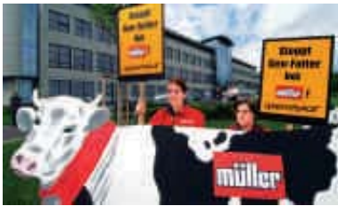
2004 – Protest gegen Konzern Müllermilch

2004 Rund 1,5 Millionen Ratgeber „Essen ohne Gentechnik“ werden verteilt. Er enthält Listen mit Firmen, die gentechnikfreie Lebensmittel garantieren. ▶ Gegen Gen-Pflanzen in Futtermitteln protestiert Greenpeace beim Konzern Müllermilch. ▶ Kampagne für die Meere: Greenpeace ist in Nord- und Ostsee unterwegs und fordert Meereschutzgebiete.