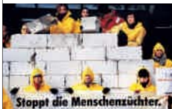
2000 – Protest am Europäischen Patentamt

1999 Aktivisten kennzeichnen Felder, auf denen die Raiffeisen eG heimlich Genmais von Novartis anbaut. ▶ Deutsche Supermarktketten erklären im März, bei ihren Lebensmittel-Eigenmarken auf Gentechnik zu verzichten. ▶ Weltweite Kampagne zur Rettung des Amazonas, des größten tropischen Regenwaldes der Erde.