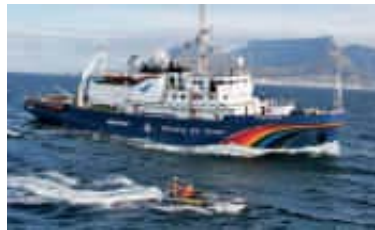
2005 – „Esperanza“ auf der Tour „SOS Weltmeer“

2005 Der Ratgeber „Essen ohne Pestizide“ erscheint – mit Tipps für den Einkauf von Obst und Gemüse ohne giftige Spritzmittel. ▶ Die „Esperanza“ startet eine einjährige Weltreise zur Kampagne „SOS Weltmeer“, dokumentiert u. a. die Überfischung und Verschmutzung der Meere und fordert echte Schutzgebiete weltweit. ▶ Mit einem fünf Meter hohen Dinosaurier aus Schrott tourt Greenpeace durchs Land, um gegen die geplanten Laufzeitverlängerung für deutsche Atomkraftwerke zu protestieren.