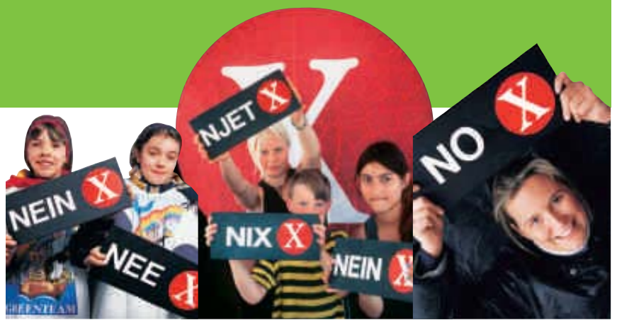
1998 – genetiXproject gegen Gentechnik

1999 Aktivisten kennzeichnen Felder, auf denen die Raiffeisen eG heimlich Genmais von Novartis anbaut. ▶ Deutsche Supermarktketten erklären im März, bei ihren Lebensmittel-Eigenmarken auf Gentechnik zu verzichten. ▶ Weltweite Kampagne zur Rettung des Amazonas, des größten tropischen Regenwaldes der Erde.