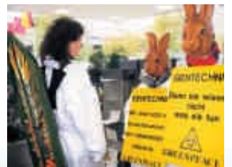
1997 – Aktion gegen Gentech-Lebensmittel

weit über den Umweltschutz hinaus. Immer wieder gibt es dafür anerkennendes Lob von namhafter Stelle, beispielsweise von UNO, Weltbank, Regierungen und Behörden. Was Greenpeace einst anprangerte, wird heute von Behörden als gesetzwidrig verfolgt – etwa die Giftmüllentsorgung in Entwicklungsländer, die Verwendung von hormonschädigenden Schiffsanstrichen, die Nicht-Kennzeichnung von Gen-Lebensmitteln.