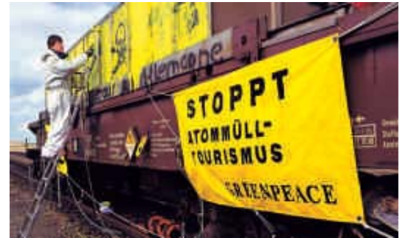
1991 – Protest gegen Atommülltransporte

▶ Das Kinder- und Jugendprojekt wird aus der Taufe gehoben. ▶ 1700 Großplakate prangern die Chefs der Chemie-Industrie an: „Alle reden vom Klima – wir ruinieren es“. ▶ Greenpeace veröffentlicht geheim gehaltene Routen, auf denen in Deutschland Atommüll transportiert wird.