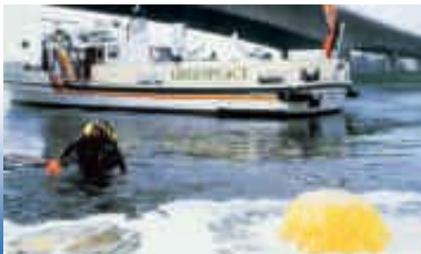
1986 – Die „Beluga“ auf der Weser

1985 Die „Beluga“, mit Chemielabor an Bord, nimmt ihre Arbeit gegen Flussverschmutzung auf. Im Visier sind vor allem die Papierhersteller, die Chlorbleiche-Abwässer einleiten. ▶ Die „Rainbow Warrior“ wird in Auckland vom französischen Geheimdienst versenkt. Ein Greenpeace-Fotograf stirbt.