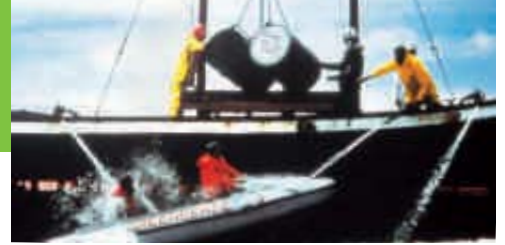
1981 – Aktion gegen Atommüll-Versenkung