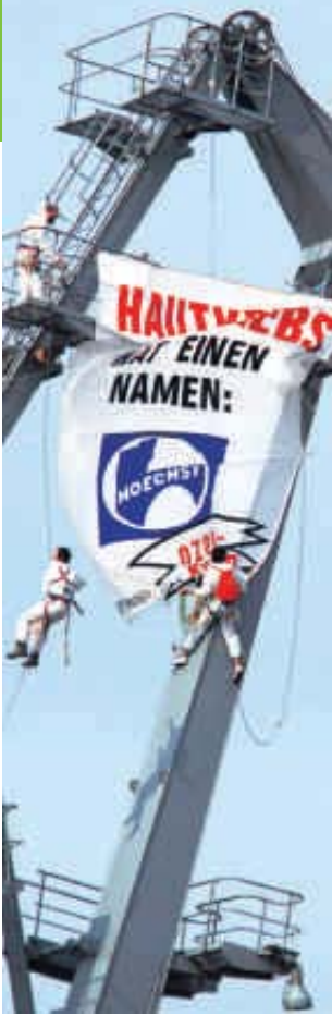
1989 – FCKW-Aktion bei Hoechst

Greenpeace bringt nicht nur Umwelt-skandale ans Licht der Öffentlichkeit, sondern entwickelt auch Lösungen. Die beweisen, dass es anders geht – sehr zum Ärger der Industrie. 1992 zeigt der „Greenfreeze“: Kühlschränke lassen sich ohne FCKW und FKW und somit ozon- und klimaschonend herstellen. 2002 zeigt es Greenpeace der deutschen Autoindustrie und präsentiert ein Dieselauto mit nachträglich eingebautem Dieselfußfilter. Dieser hält die gefährlichen Rußpartikel zurück und schützt die Menschen vor diesem Feinstaub und damit vor Dieselkrebs und anderen Krankheiten.