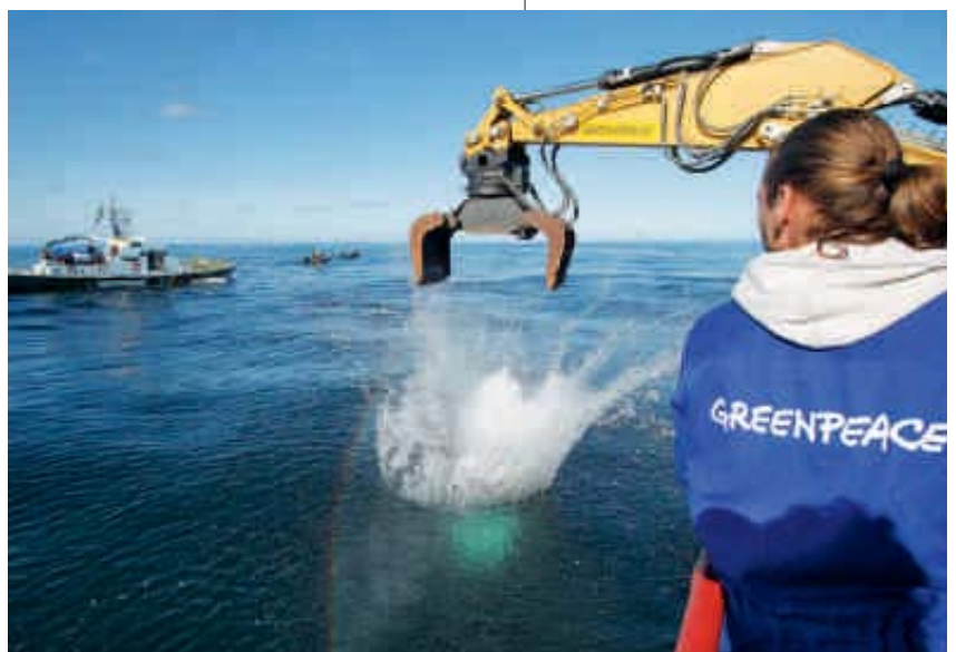
2008 – Aktion am Sylter Außenriff für den Schutz der Fischbestände

2008 Mit Hilfe der „Beluga II“ und einem Arbeitsschiff versenkt Greenpeace Hunderte Natursteine am Sylter Außenriff (Nordsee) auf dem Meeresgrund, um das Naturschutzgebiet vor Grundschleppnetzfischerei zu bewahren. ▶ Das Meeresmuseum Ozeaneum in Stralsund wird eröffnet, darin die spektakuläre Greenpeace-Ausstellung „1:1 Riesen der Meere“ – mit Wal-Modellen in Originalgröße und vielen Infos über die bedrohten Meerestiere.