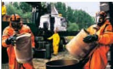
1992 – Giftmüll-Aktion in Rumänien

1991 Aktivisten stoppen einen Transport mit radioaktiver Fracht aus dem Atomkraftwerk Unterweser in die Wiederaufarbeitungsanlage Sellafield. ▶ Riesenerfolg: 26 Staaten unterzeichnen das Antarktis-Schutzprotokoll, das den Rohstoffabbau für 50 Jahre verbietet. ▶ Greenpeace bringt ein Plagiat des „Spiegel“ heraus: als erste Zeitschrift auf chlorfrei gebleichtem Tiefdruck-Papier.