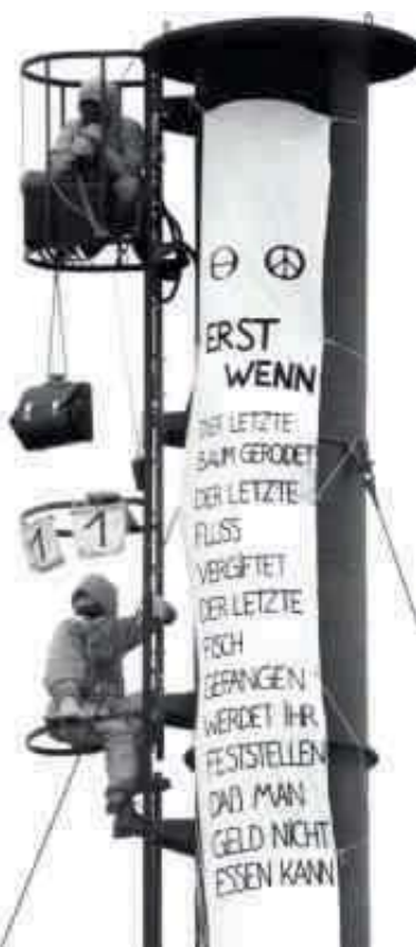
1981 – Aktion gegen Giftschleuder Boehringer

Im Jahr 1980 kennt kaum jemand in Deutschland Greenpeace. Umweltschutz ist für die meisten ein Fremdwort. Das ändert sich nach der Gründung des deutschen Greenpeace-Büros: In den 80er Jahren decken die Umweltschützer zahlreiche Umweltskandale auf und benennen Umweltsünder. Spektakuläre Aktionen sorgen für Schlagzeilen und machen Missstände einer breiten Öffentlichkeit bekannt. Damit setzt Greenpeace die Verantwortlichen erfolgreich unter Druck, ihr umweltschädliches Verhalten zu ändern.