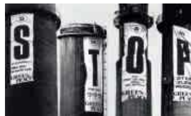
1984 – Protest an Kohlekraftwerken

1984 Gegen sauren Regen und Waldsterben: Greenpeacer besetzen zeitgleich in acht europäischen Ländern die Schloten von Kohlekraftwerken .