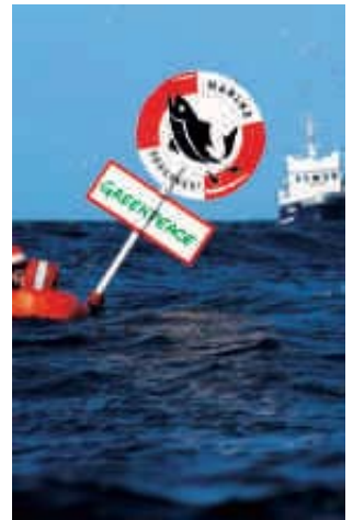
2004 – Meeres-Schutz-Aktion

Greenpeace motiviert zum Umwelt-Engagement, zum kritischen Umgang mit Institutionen und damit gegen Politik-Verdrossenheit und Resignation. Tausende Kinder, Jugendliche und Erwachsene, die sich ehrenamtlich für Greenpeace-Themen einsetzen, tragen die Arbeit der Organisation bis in die letzte Ecke der Republik und sind Beweis einer lebendigen demokratischen Gesellschaft. Greenpeace ist überzeugt, dass jeder und jede Einzelne zur Veränderung der Welt beitragen kann.