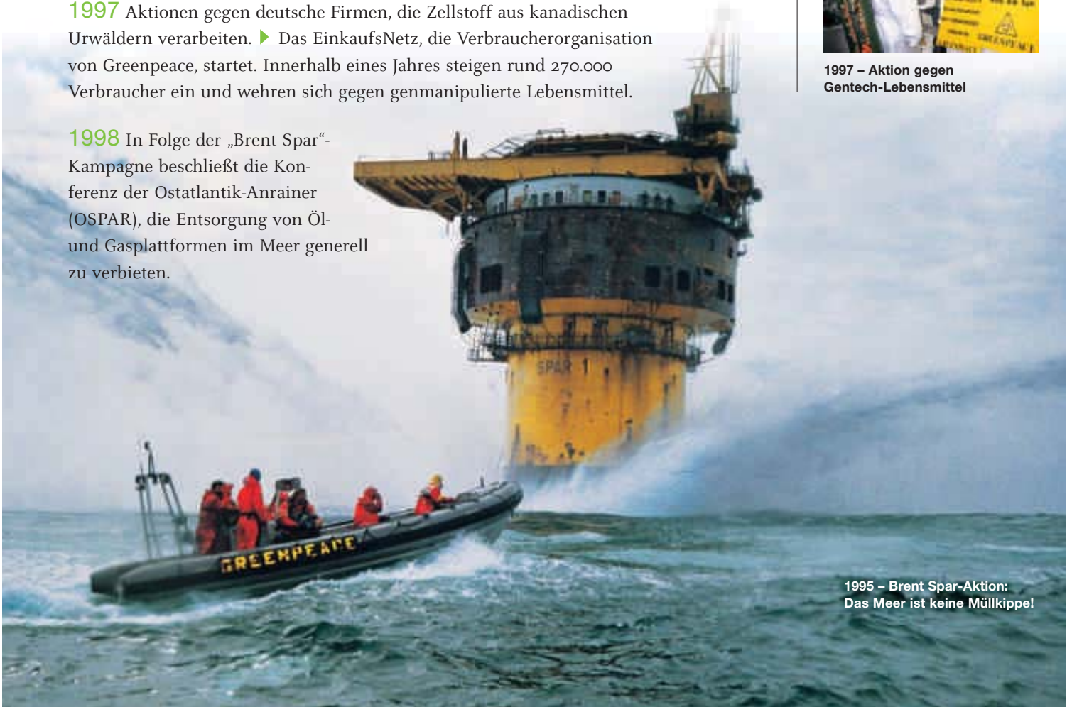
1995 – Brent Spar-Aktion: Das Meer ist keine Müllkippe!