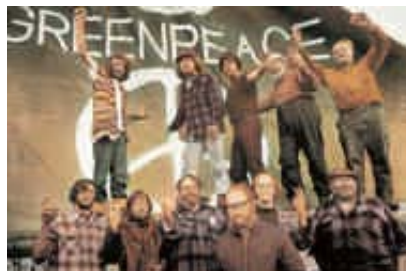
1971 – Protest gegen Atomtests

1971 Im kanadischen Vancouver gründet sich Greenpeace. Eine Hand voll Umweltschützer sticht am 15. September in See, um amerikanische Atomwaffentests auf der Insel Amchitka vor Alaska zu verhindern. 1972 Ausweitung des Widerstands auf französische Atomtests im Südpazifik. 1975 Start der Walekampagne im Pazifik: Aktivisten fahren mit Schlauchbooten in die Schusslinie der Harpunen. 1976 Auftakt der Kampagne zum Schutz der Robben in Neufundland. 1977 Greenpeace kauft das erste eigene Schiff, die „Rainbow Warrior“, und erhält Beobachterstatus bei der Internationalen Walfangkommission (IWC).