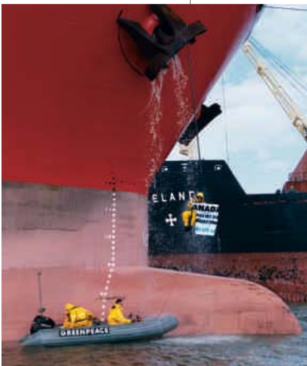
1998 – Aktion für Urwaldschutz

2003 „Nein“ zum Irakkrieg! Weltweit setzen sich Greenpeacer mit Aktionen für den Frieden ein. ▶ Das EinkaufsNetz, ein Verbraucherprojekt von Greenpeace, startet eine Kampagne gegen Gift und Gentechnik im Essen. ▶ Die Umweltstiftung Greenpeace unterstützt den Tierpark Warder, um seltene europäische Nutztierassen vor dem Aussterben zu bewahren.