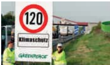
2007 – Autobahn-Protest fürs Klima

2006 An der Ostseeküste strandet ein 17 Meter langer toter Finnwal. Greenpeace transportiert das Tier nach Berlin und protestiert damit vor der japanischen Botschaft gegen den Walfang. ▶ Greenpeacer nehmen Proben gentechnisch veränderter Maispflanzen auf einem Feld bei Borken (Nordrhein-Westfalen). Der Mais der Firma Monsanto enthält Gift, das nicht nur Schädlinge, sondern auch Schmetterlinge und andere Insekten töten kann.